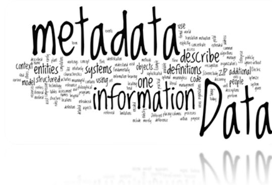
Gambar 1. Ilustrasi Metadata

Berdasarkan contoh di atas, tidak mengherankan wikipedia mengartikan metadata sebagai “ data about data “, yaitu data yang mengandung informasi data lainnya. Dengan mengacu pada metadata, aplikasi yang membaca metadata tersebut dapat melakukan identifikasi, klasifikasi, dan pengorganisasian (Standards Institute), atau ISO (International Organization for Standardization).