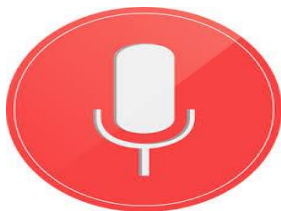
Gambar 2 Google Now

Tampilan yang diperlihatkan bias dikatakan terbaik dari yang lain karena dalam pengaturan tampilanya sangat friendly (mudah dipahami) dan sudah terklasifikasi berdasarkan jenisnya lewat menu customize.