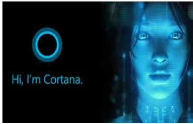
Gambar 1 : Cortana Microsoft