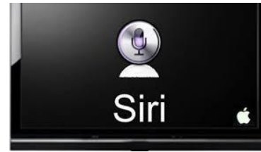
Gambar 3 : siri Apple

pengguna iOS Oktober 2013, hanya 15,2 persen pengguna iOS yang menggunakan Siri.