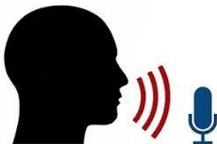
Gambar 6 : Pengenalan suara manusia pada mesin

Speech synthesis merupakan hasil kecerdasan buatan dari pembicaraan manusia. Komputer yang digunakan untuk tujuan ini disebut speech sythesizer dan dapat diterapkan pada perangkat lunak dan perangkat keras. Sebuah sistem text to speech (TTS) merubah bahasa normal menjadi pembicaraan.