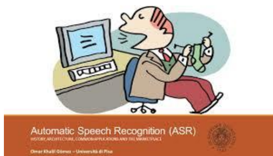
Gambar 5 : Pengenalan suara

Pengenalan suara otomatis atau pengenalan suara komputer (computer speech recognition). Merupakan salah satu fitur antarmuka telematika yang merubah suara menjadi tulisan. Istilah ‘voice recognition’ terkadang digunakan untuk menunjuk ke speech recognition dimana sistem pengenalan dilatih untuk menjadi pembicara istimewa, seperti pada kasus perangkat lunak untuk komputer pribadi, oleh karena itu disana terdapat aspek dari pengenalan pembicara, dimana digunakan untuk mengenali siapa orang yang berbicara, untuk mengenali lebih baik apa yang orang itu bicarakan. Speech recognition merupakan istilah masukan yang berarti dapat mengartikan pembicaraan siapa saja