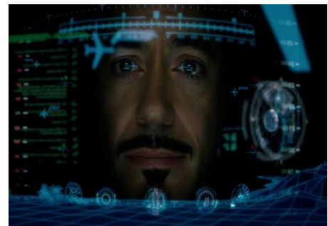
Gambar 1 : tampilan antarmuka HUD

Pada fitur ini menampilkan sebuah tampilan transparan yang menampilkan beberapa data yang dibutuhkan pengguna dapat melihat informasi dengan kepala yang terangkat ( head up ) dan melihat ke arah depan daripada melihat ke arah bawah bagian instrumen, pada fitur ini pengguna mempunyai sudut pandangan yang berbeda dari biasanya sehingga mempermudah mengakses data yang dibutuhkan , untuk lebih jelasnya saya perjelas dengan gambar sebagai berikut . disini adalah tampilan visual transparan yang menggambarkan informasi situasi ketika membutuhkan data tertentu