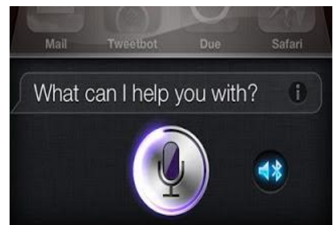
Gambar 4 : tampilan Browsing Audio Data

mendengarkan sebuah kilasan lagu dan kemudian kita merasa terkesan dengan lagu tersebut. Meskipun kita hanya mendengarkan secara sekilas, tetapi membuat kita ingin tahu lagu siapakah itu? Browsing audio data pada suara tidak seperti browsing teks pada tulisan. Hal ini disebabkan perbedaan sifat antara tulisan dan suara jadi di artikan bahwa kemampuan mesin untuk mencari data dengan menggunakan input audio. Karena sifat suara yang tidak permanen itulah maka untuk melakukan pencarian dalam audio data harus selalu dilakukan pengulangan dalam membunyikan suara tersebut. Browsing audio data dilakukan dengan cara konsep pendengar dan pembicara/speaker. Sebuah rekaman suara dirubah menjadi beberapa bagian dan setiap bagian akan dibunyikan oleh pembicara/speaker yang berbeda. Semua bagian dari rekaman tersebut dibunyikan secara bersamaan atau dengan kata lain semua pembicara atau speaker sedang berbicara dalam waktu yang sama. Pendengar mendengarkan semua suara dari semua pembicara atau speaker, jika ada perkataan dari seorang pembicara (misalnya pembicara 1) yang sama atau mirip dengan kata-kata search-key yang sedang dicari maka suara dari pembicara yang lainnya akan dkecilkan untuk memperjelas dan memastikan bahwa suara dari pembicara 1 adalah yang sama kemudian didapat kesimpulan bahwa sebuah rekaman yang tadinya dipotong menjadi beberapa bagian itu adalah data audio yang sedang dicari.