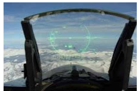
Gambar 2 : tampilan HUD pada pesawat F16