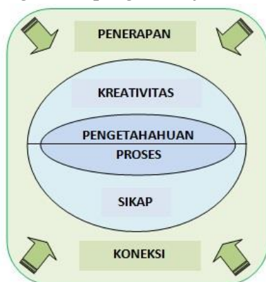
Gambar 1. Lima Domain dalam Pembelajaran Sains

Belajar dan pembelajaran sains merupakan (1) pendeskripsian dan penggambaran bermacam interaksi pembelajaran dalam kelas, (2) mendemonstrasikan dan mencontohkan dengan bahasa pembelajaran sains dasar di kelas, dan (3) menunjukkan bagaimana ide dapat digunakan untuk menunjukkan pengembangan profesional guru sains (Mortimer & Scott, 2003). Untuk mengoptimalkan pembelajaran sains tersebut dapat diupayakan melalui lima ranah dalam a new "taxonomy for science education" yang dikembangkan oleh Allan J MacCormack dan R.E. Yager meliputi: (1) ranah pengetahuan, (2) ranah proses sains, (3) ranah kreativitas, (4) ranah sikap/atitude, dan (5) ranah aplikasi dan koneksi (Prasida, 2016). Kelima ranah taksonomi pendidikan sains dapat dilihat pada Gambar 1. Pengembangan taksonomi melihat bahwa kelima ranah penting dalam membantu siswa membebaskan diri dari buta sains yang diperlukan untuk hidup bermasyarakat, contohnya kelima ranah ini diperlukan dalam menyelesaikan masalah yang dihadapi agar menjadi kehidupan kelak yang lebih baik.