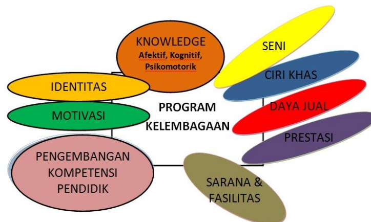
Gambar. 1. Konstelasi Urgensi Dalam Fasilitasi Program Kelembagaan Dan Pembelajaran Jenjang Sekolah Dasar

Dalam mendesain suatu Manajemen berbasis sekolah, misalnya dalam aspek program sekolah, seyogyanya kepala sekolah beserta dengan warga sekolah dan melibatkan unsur masyarakat (komite sekolah) mengetahui beberapa prinsip dan analisis dalam rangka merencanakan program sekolah berbasis MBS, khususnya di sekolah Dasar (Iskak, 2018; Ramdan et al., 2019) yaitu, (1) desain dan aplikasi perumusan program kelembagaan institusi sekolah dasar, dalam menyusun program sekolah atau kelembagaan seyogyanya, warga sekolah meliputi Pendidik dan Tenaga Kependidikan harus mempertimbangkan dan menyelaraskan dengan standar nasional pendidikan, kurikulum, tujuan dan evaluasi pembelajaran, guna menjadikan program yang disusun menjadi relevan dan dapat diterapkan dan dirasakan langsung manfaatnya. (2) Mekanisme penyusunan program kelembagaan pada jenjang Sekolah Dasar, dalam menyusun program kelembagaan sekolah, seyogyanya harus memahami dan mempertimbangkan beberapa hal yang ikut menentukan keberhasilan suatu program yang akan dilaksanakan, yakni tujuan nasional, standar nasional pendidikan, faktor pendidik, tenaga kependidikan, kurikulum, dan kebijakan sekolah. (3) Evaluasi program kelembagaan, dalam