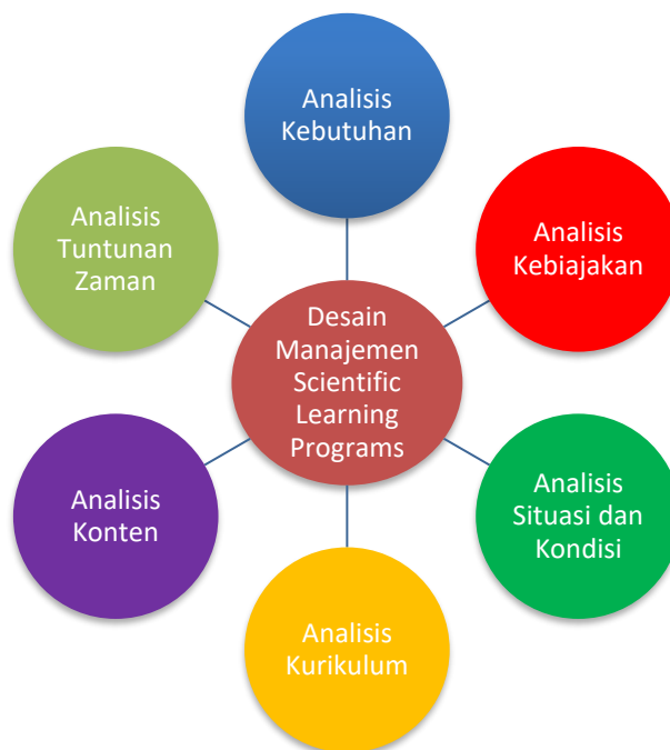
Gambar 2. Analisis Perencanaan Desain Manajemen Scientific Learning Programs

Selanjutnya, Desain Manajemen Scientific Learning Programs merupakan suatu program pembelajaran ilmiah yang disusun dan dirancang dengan terarah, dengan tujuan memberikan aktivitas pembelajaran yang aktif, kolaboratif, kreatif dan keterampilan sosial (Rahmat, 2019). Desain Manajemen Scientific Learning Programs dirancang dalam bentuk program sekolah atau bisa juga kearah khusus yakni program pembelajaran kelas. Desain Manajemen Scientific Learning Programs dijadikan sebagai salah satu solusi untuk memberikan optimisasi dan penguatan keterampilan kolaboratif pada diri siswa. Desain Manajemen Scientific Learning Programs disusun berdasarkan atas beberapa analisis utama sebagai mana dinyatakan dalam gambar berikut.